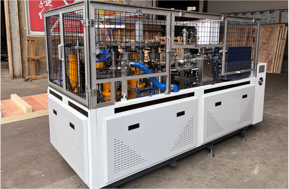
SM DW-150 Yüksek Hızlı Çift Duvar Kağıt Bardak Makinası